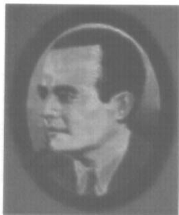
Ilustración 4. Roberto F. Chiari, durante su gestión al mando de la Presidencia de la República, se construyeron muchas escuelas en el interior del país.

La reducción de los adherentes, a 5,000, dio pie para que los partidos políticos se incrementaran en nuestro país. Por tanto, en las elecciones del 2 de mayo de 1960, las alianzas electorales prevalecieron. Los candidatos, para estas elecciones, fueron: Roberto Chiari Remón, por la Unión Nacional de Oposición (UNO), Ricardo Arias Espinosa, por la Coalición Patriótica Nacional (CPN) y Víctor Florencio Goytía, por la Alianza Popular (AP). En estos comicios, resultó electo el candidato de la Unión Nacional de Oposición, Roberto Francisco Chiari Remón, con un total de 100.042 votos. El más cercano fue Ricardo Arias Espinosa, con un total