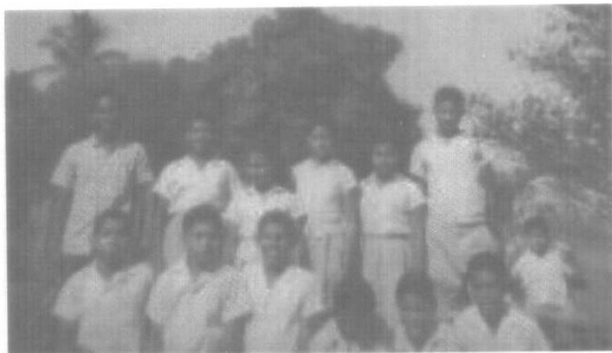
Ilustración 6. Grupo de estudiantes graduados en la nueva Escuela en 1967.

una oportunidad de los que buscan una mejor vida, mediante sus propios esfuerzos” 31 . Entre tanto, el Ministro de Educación, expresó que: “En la educación de Panamá, sí hay Alianza, sí hay progreso” 32