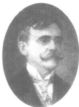
Ilustración 2. Belisario Porrás en cuyo mandato Presidencial nombra la primera maestra en la comunidad de Potuga.

sentimental entre Porrás y la Señorita Canto; para designar a la Comunidad de Potuga como centro de la primera escuela rural del distrito de Parita? Esta escuela recogía los estudiantes de diferentes partes de este distrito, principalmente de los Higos y Cabuya.