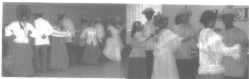
Conjunto de Proyección Folclórica bajo la dirección e Instrucción del Autor, ejecutando bailes de la región de Tonosí.

sus bailes más raizales, tales como las Denesas, la Guaniqueña, el Salao, el Chote, entre otros. Lo mismo ocurre con La Chorrera, en la provincia de Panamá, donde nos muestran los tambores ciénaga, norte y corridos; y sus famosas cumbias, immortalizadas por Carlos "Nato Califa", Isaac y su inseparable cantante Chía Ureña; o en Antón, provincia de Coclé, tierra del siempre recordado, Armando Del Rosario, cuna de maruchas, fachenda 7 y cuyo tambor cadencioso, se exhibe con el acompañamiento del almírez 8 . Son éstos, pues, aquellos grupos o conjuntos de carácter regional, cuya expresión y ejecución auténtica, es desarrollada por los moradores y residentes del lugar en que se practica, dicha manifestación de nuestro folclore.